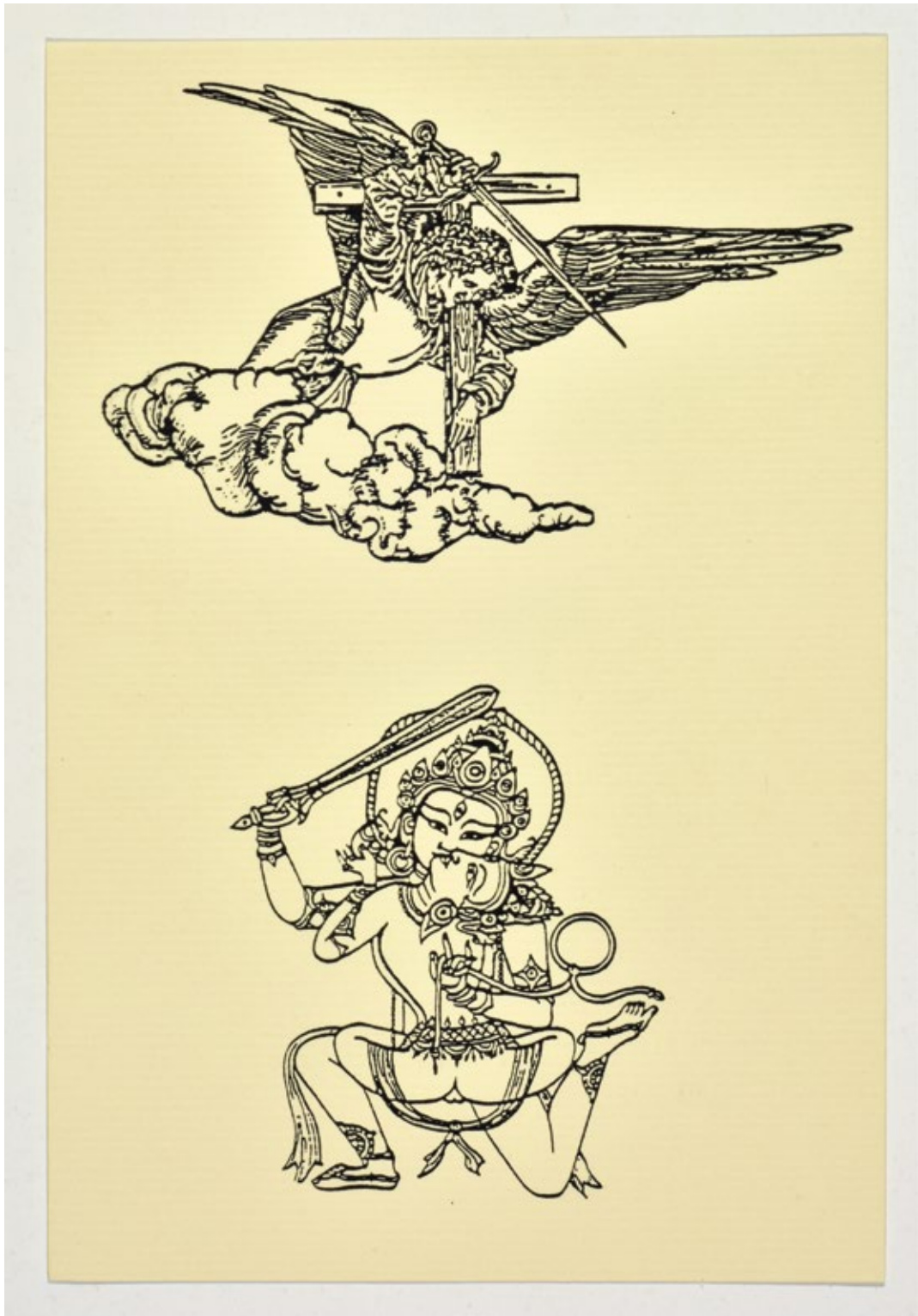
León Ferrari, "O anjo com a cruz", imagen de collage, 1986, postal, impresión sobre papel, 15,7 x 11 cm, ediciones EXU, 1988.