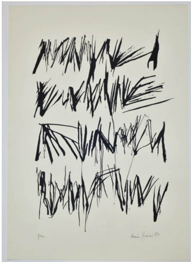
León Ferrari, Sin título, prueba de artista, 1984, serigrafía, 34,9 x 24,9 cm.

En 2007, recibió el León de Oro al mejor artista en la 52.º Exposición Internacional de Arte Bienal de Venecia, Italia. En 2009, realizó una exposición en el Museo de Arte Moderno (MoMA) de Nueva York y, en 2010, fue invitado de honor en Les Rencontres d'Arles, Francia, ocasión en la que presentó una gran retrospectiva de su obra.