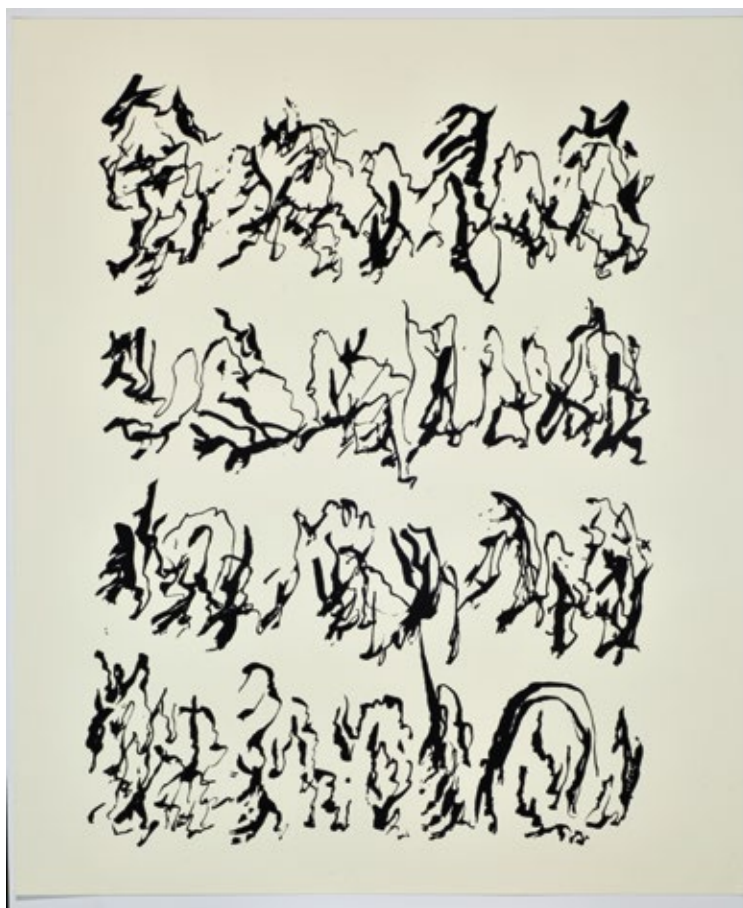
León Ferrari, Sin título, serigrafía, 33 x 28 cm.

El Museo Nacional de Bellas Artes, que depende del Ministerio de Cultura de la Nación y cuenta con el apoyo de Amigos del Bellas Artes, está ubicado en Av. del Libertador 1473 (Ciudad de Buenos Aires) y puede visitarse, con entrada gratuita, de jueves a domingo, de 12 a 19. Para reservar turnos y conocer el protocolo sanitario vigente, hay que ingresar a www.bellasartes.gob.ar .