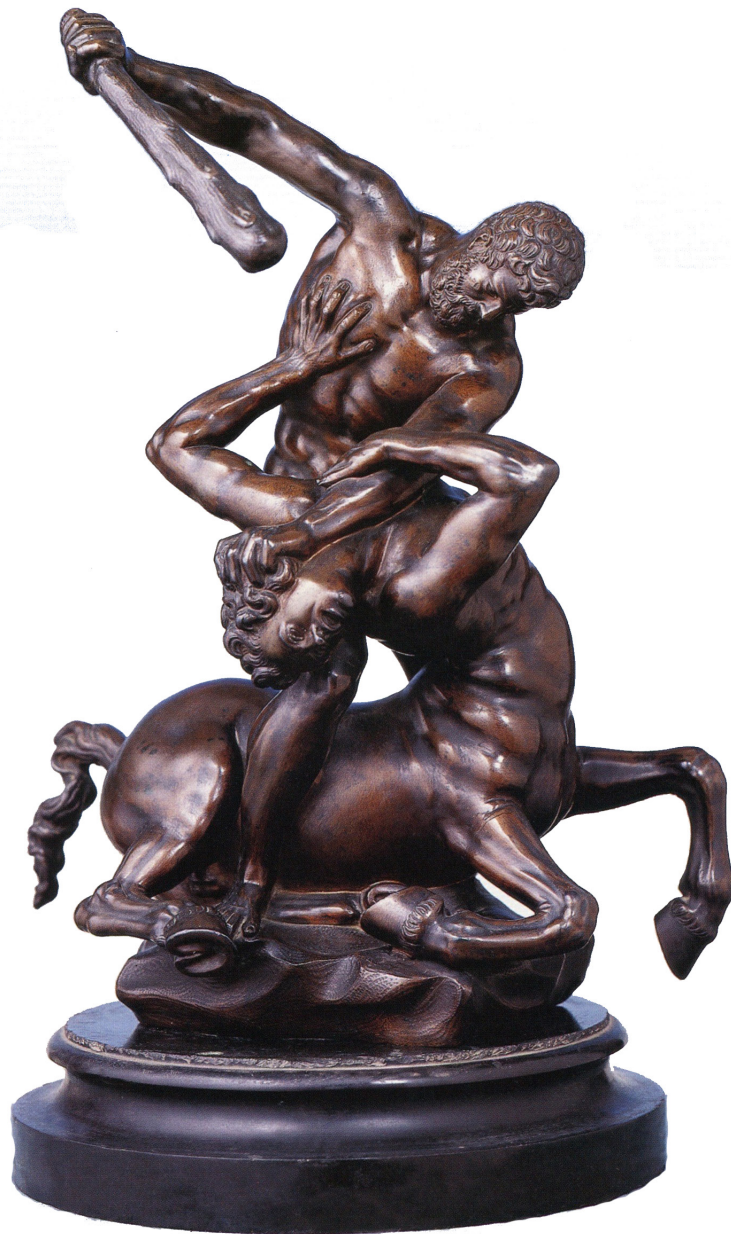
Giambologna (Jean Bologne de) Francia, Douai, 1529 ~ Italia, Florencia, 1608 Hércules derriba al Centauro Bronce 36 × 28,5 × 20 cm Colección Museo Nacional de Bellas Artes

Giambologna es considerado uno de los escultores referentes del Manierismo.