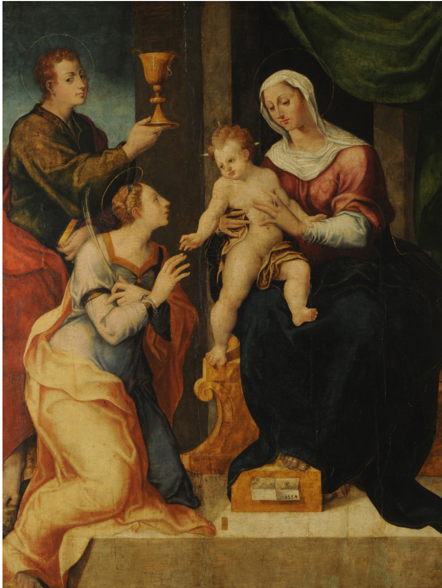
Pietro Negrone (Zingarello) Italia, Cosenza, 1503 ~ Italia, Nápoles, 1565 Bodas místicas de Santa Catalina 1554 Óleo sobre tabla 139 × 109 cm Colección Museo Nacional de Bellas Artes

Todos los elementos que componen esta pieza expresan la violencia de los movimientos y la tensión del relato bíblico.