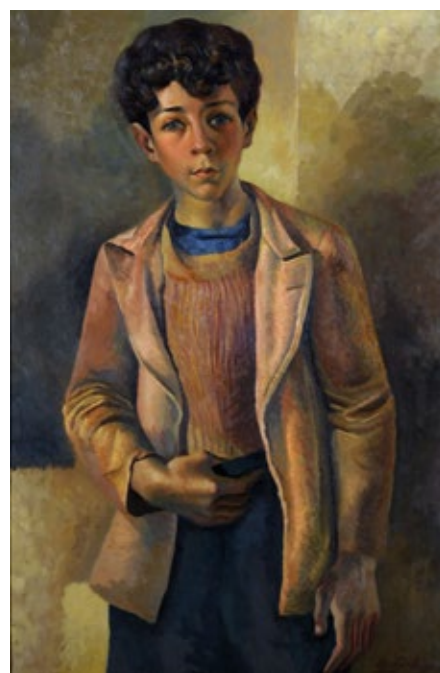
Lino Enea Spilimbergo Figura o retrato de muchacho , 1942 Óleo sobre tela, 113 × 76 cm Museo Nacional de Bellas Artes