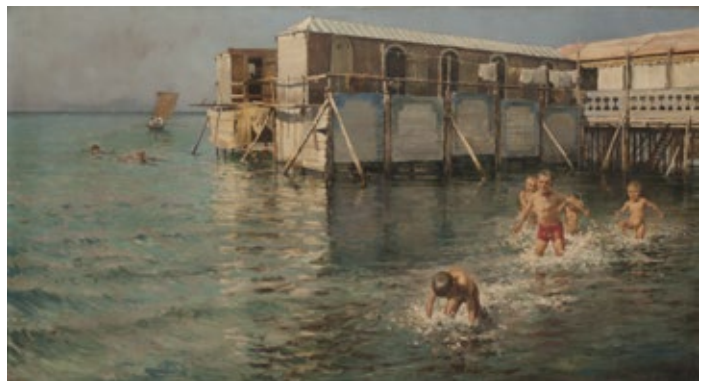
Vincenzo Caprile Baños de mar (Guaglioni) , 1887 Óleo sobre tela, 83 × 150,5 cm Museo Nacional de Bellas Artes