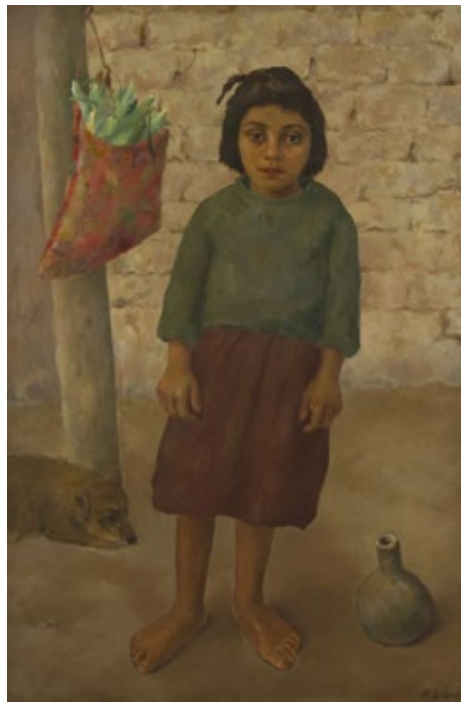
Ramón Gómez Cornet La Urpila , 1946 Óleo sobre tela, 130 × 89 cm Museo Nacional de Bellas Artes