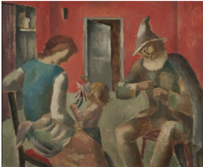
Eugene Zak Le guignol [El guiñol] Óleo sobre tela, 54,5 × 65 cm Museo Nacional de Bellas Artes