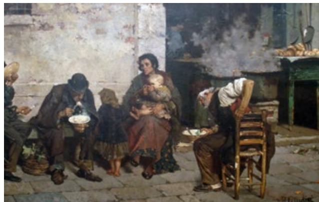
Reynaldo Giudici La sopa de los pobres , 1884 Óleo sobre tela, 147 × 228 cm Museo Nacional de Bellas Artes