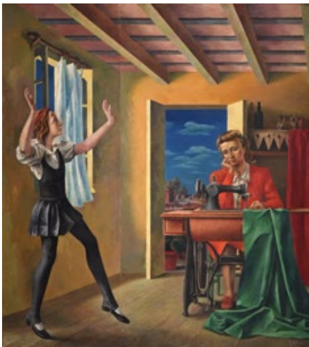
Antonio Berni Primeros pasos , 1936 Óleo sobre tela, 200 × 180 cm Museo Nacional de Bellas Artes