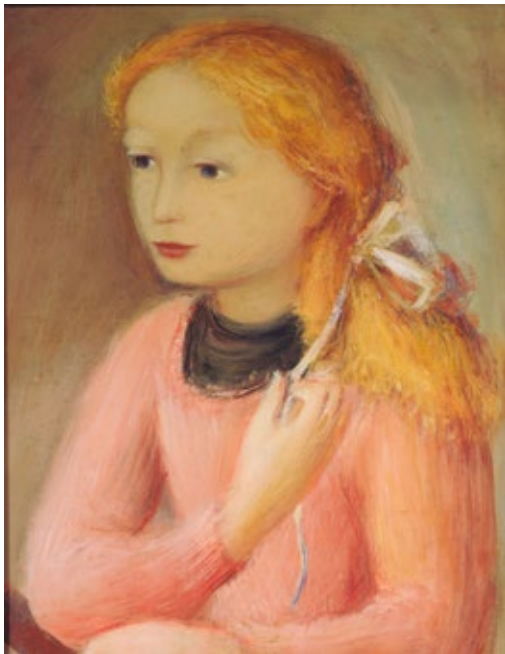
Raúl Soldi Niña vestida de rosa Témpera sobre madera terciada, 56 × 40,5 cm Museo Nacional de Bellas Artes

¿Cómo son los niños y niñas que aparecen en estas obras? ¿Dónde vivirán?