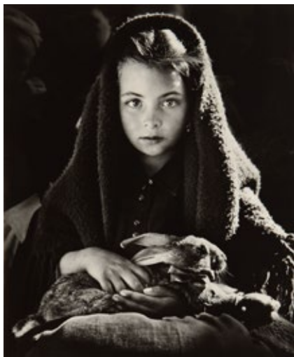
Jean Dieuzaide Nazare , 1954 Fotografía, 29,8 × 24,5 cm Museo Nacional de Bellas Artes