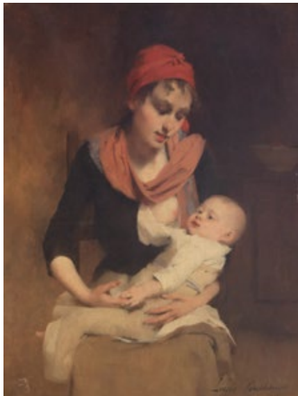
Louis Henri Deschamps La jeune mère [Madre joven] Óleo sobre tela, 65,5 × 50 cm Museo Nacional de Bellas Artes