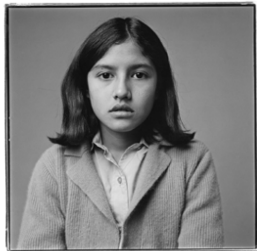
Juan Travník Adolescencia , 1981 Fotografía, 28 × 27,5 cm Museo Nacional de Bellas Artes