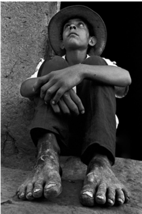
Carlos Bosch Pies de barro , 1970 Fotografía, 60 × 30 cm Museo Nacional de Bellas Artes

Observen a los chicos y las chicas de estas obras. ¿Qué les estará pasando? ¿Cómo piensan que se sienten? ¿Creen que se están cumpliendo estos derechos?, ¿por qué?