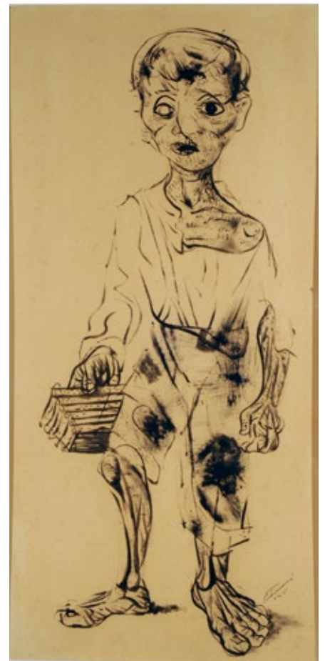
Cândido Portinari Los Meninos de Brodowsky Dibujo sobre papel, 80 × 40 cm Museo Nacional de Bellas Artes