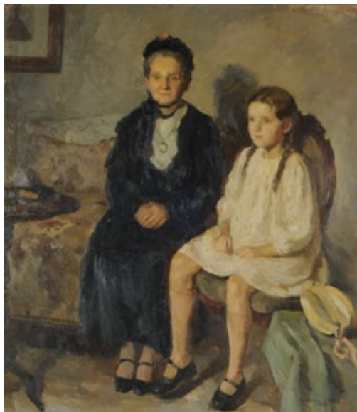
Ana Weiss de Rossi La abuelita , 1939 Óleo sobre tela, 137 × 121,5 cm Museo Nacional de Bellas Artes