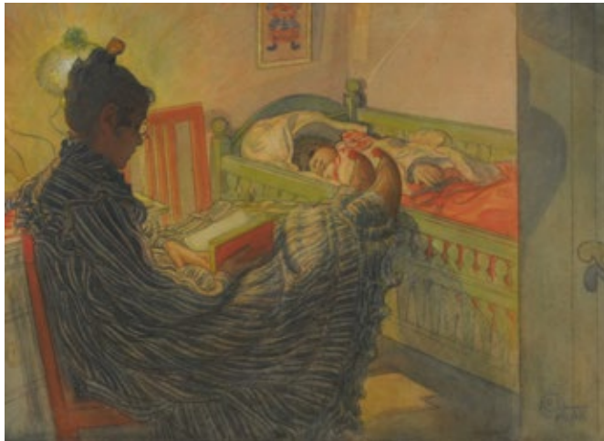
Carl Olof Larsson Le soi disant malade [El supuesto enfermo], 1908 Acuarela y pastel, 51 × 71,5 cm Museo Nacional de Bellas Artes

Los chicos y chicas presentes en estas obras, ¿qué cuidados reciben?