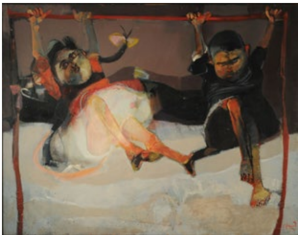
Carlos Alonso Niños colgados , 1964 Acrílico sobre madera, 125 × 160 cm Museo Nacional de Bellas Artes