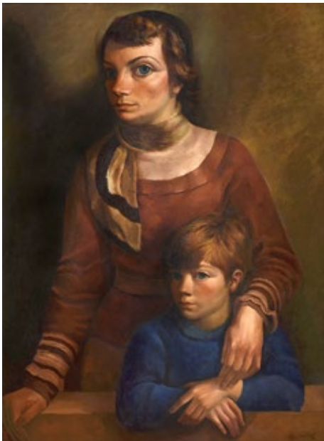
Lino Enea Spilimbergo Figuras , 1937 Óleo sobre tela, 130 × 95 cm Museo Nacional de Bellas Artes

¿Qué características tienen las familias que protagonizan las obras? ¿Cómo son? ¿Cómo serán sus hogares?