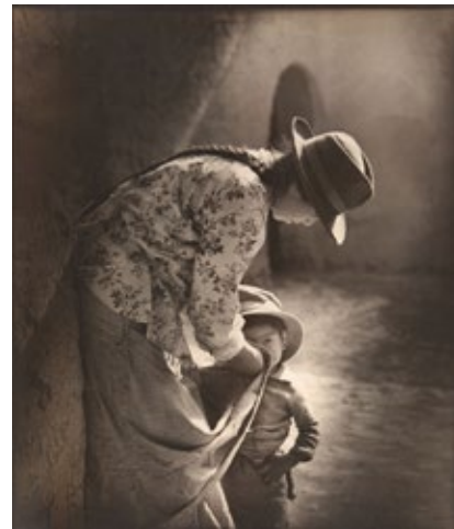
Alejo Grellaud Madre coya , 1940 Fotografía, 43,9 × 37 cm Museo Nacional de Bellas Artes